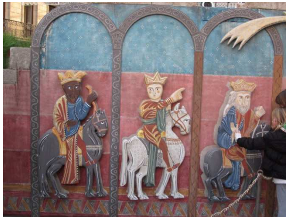
Begehbare Weihnachtsgeschichte, Fußgängerzone Barcelona, Advent 2011

Begehbare Krippe: Stationen der Weihnachtsgeschichte mit großen Figuren in einem abgegrenzten Bereich können im Einbahnstraßensystem abgegangen werden.